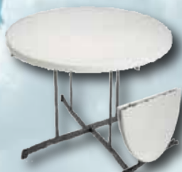
Rundt bord: Fold in half

Ø 153 cm - Vægt: 20 kg Farve: Granit og mandel