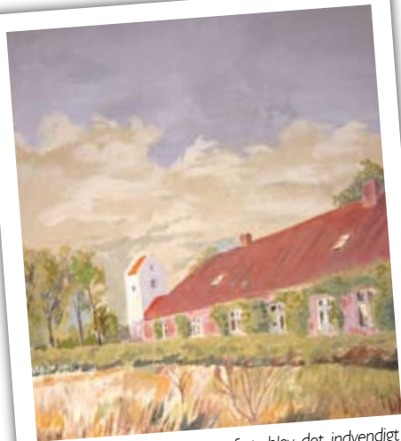
Da forsamlingshuset blev opført, blev det indvendigt udsmykket af en omrejsende malersvend. Hans vægmalerier med motiver fra byen klæder stadigvæk forsamlingshusets vægge.

I Norup er kun forsamlingshuset tilbage, men der er i 1966 etableret en friskole som erstatning for den gamle kommuneskole, der blev nedlagt samme år.