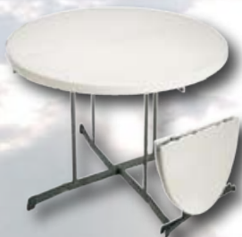
Rundt bord: Fold in half

Ø 153 cm - Vægt: 20 kg Farve: Granit og mandel