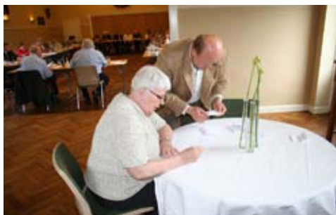
Stemmerne tælles op.

Jeg anbefaler forsamlingshusbestyrelserne i de nye storkommuner til at gå sammen og nedsætte et forhandlingsudvalg, som så skal henvende sig til det kulturelle sammenlægningsudvalg og prøve at få en forhandling i