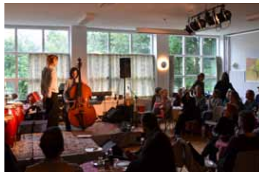
Vrads Forsamlingshus er et landsby kulturhus