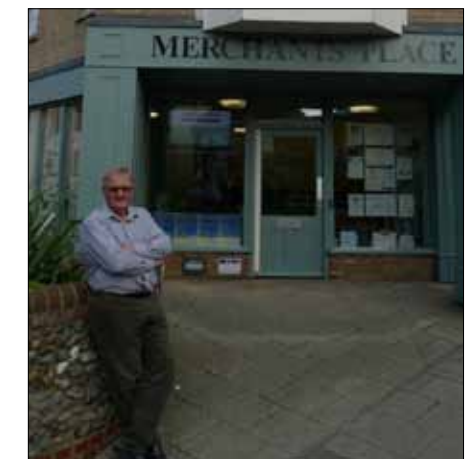
Formand foran Merchants Place, der er udgangspunkt for erhvervsuddannelsesstilbud til arbejdsløse i byen Crome, Norfolk.

fessionel paraplyorganisation, der kan støtte, stimulere og vise vej for forsamlingshusenes engagement i den lokale udvikling. Den rolle kunne, forestiller deltagerne sig, i Danmark også varetages af et professionelt sekretariat tilknyttet Landsforeningen Danske Forsamlingshuse.