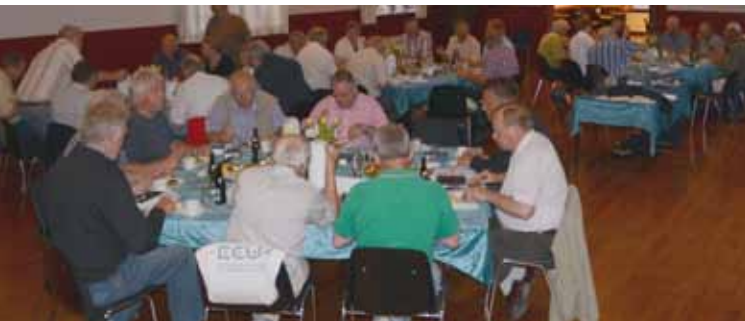
Møde i Staglille Bjernede forsamlingshus, Soro

En analyse af de danske forsamlingshuse situation – foretaget i 2010 – viser dog, at der er et behov for fokus på at udvikle huset til fremtidens krav og behov.