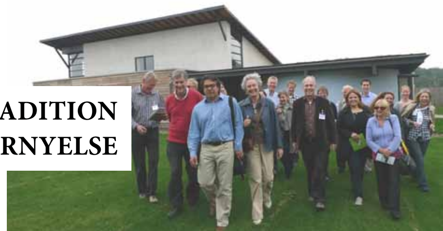
Grundtriv deltagerne foran Neatishead forsamlingshus, Norfolk

Når man rejser ud i verden, oplever man ikke kun det fremmede, man kommer også til at se sig selv i et andet lys.