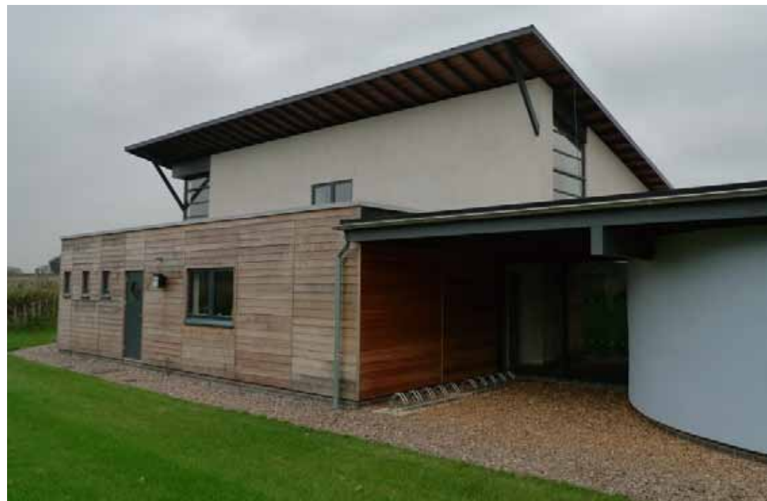
Nybygget Kultur- og forsamlingshus i Neatishead, Norfolk. Huset er bygget af halm og andre bæredygtige materialer. Huset har tilknyttet en cafe, der drives af "About with friends", der er en organisation for mennesker med indlæringsvanskeligheder. Se mere her: www.victoryhall.info

Du kan tilmelde dig nyhedsbrevet på Lokale- og Anlægsfondens hjemmeside: www.loa-fonden.dk