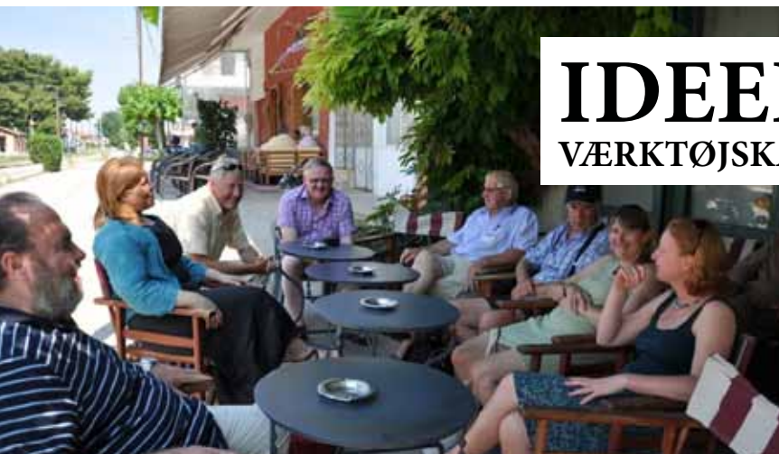
”Det åbne forsamlingshus” i landsbyen Diakopto.

Inspiration til danske forsamlingshuse var en stor del af motivationen for landsforeningens deltagelse i Learning Heart-projektet, og som en del af projektet blev der udarbejdet en værktøjskasse, som findes på denne hjemmeside: www.norfolkrc.org.uk/leah