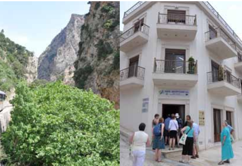
Foto tv. Fra turen med Odontotos toget op til landsbyen Kalavrita.