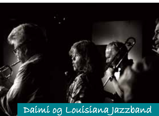
Daimi og Louisiana Jazzband

Langtved Forsamlingshus Langtved Forsamlingshus har gennem de sidste 10 år haft held til at kombinere det at leje lokaler ud som nøglehus, med at være et lokalt samlingssted for lokalområdet, og at være kulturocenter for hele Østfyn. Dette har medført at huset virkelig bliver brugt og at økonomien er god, så det også er muligt at holde bygninger og lokaler i en god standard.