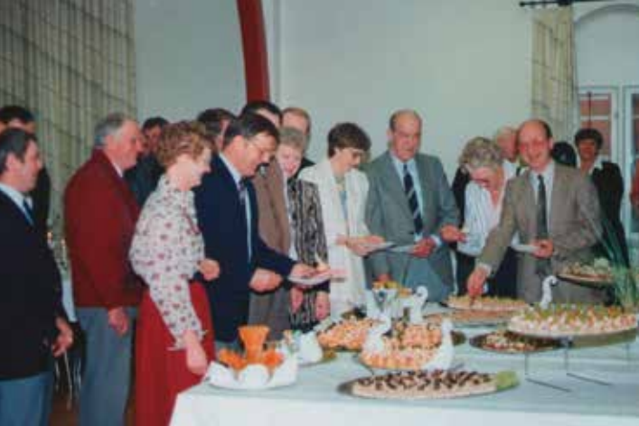
Fra indvielsesfesten 3. april 1991.