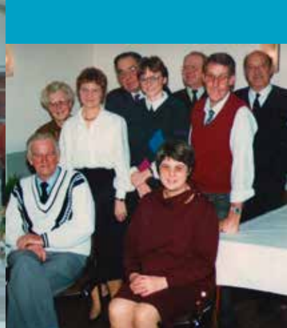
Bestyrelsen ved 100 års jubilæet. Foto: Kværndrup Forsamlingshus, 1992

til lokale håndværksmestre. Slutsummen for renovering af køkkenet blev kr. 181.000, og det nye køkken fik straks sundhedsmyndighedernes godkendelse. Som yderligere tiltag var man også begyndt på at afholde julefrokoster i forsamlingshuset i slutningen af november og begyndelsen af december måned. Dette initiativ var ikke kun tiltænkt byens borgere, men også de lokale virksomheder, som kunne benytte sig af tilbuddet, når de skulle afvikle den årlige julefrokost for medarbejderne. Efterhånden var der mange foreninger, som anvendte sponsorer for at få forretningen til at løbe rundt. Forsamlingshuset var nok en virksomhed, men også en forening, som altid havde brug for bidrag. På et bestyrelsesmøde i september 1987 oplystes det, at indtægterne fra sponsorer nu androg 30.700 kr. pr. år.