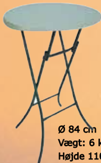
Cafebord - Ståbord