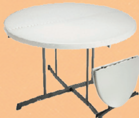
Rundt bord: Fold in half