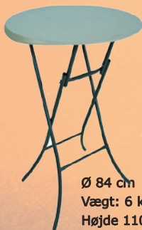
Cafebord - Ståbord