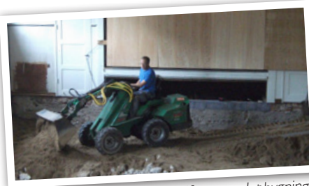
Byens borgere udfører sandopbygning for nyt terrændæk