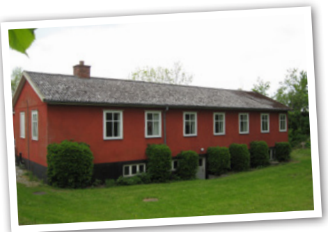
Øst fløjen set fra haven

Hele øst fløjen er fra 1948 og opført i genbrugs-materialer fra nogle barakker fra 2. verdenskrig, som blev benyttet til radarstation af tyskerne i Fræer.