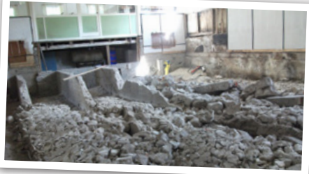
Nedbrydning af salen i juli 2013