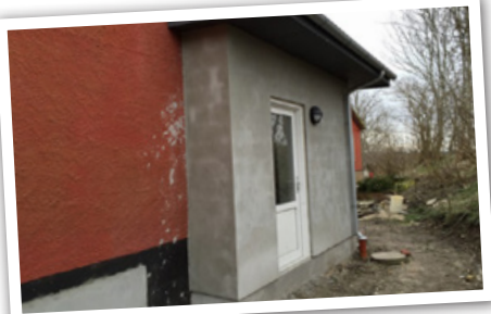
Det nye depot er bygget på nordsiden af den store sal med direkte adgang til køkken. Bygningen er varmeisoleret svarende til 2015 krav og med gulv placeret i samme niveau som salen.

Finansiering: Aalborg Kommune og eget arbejde