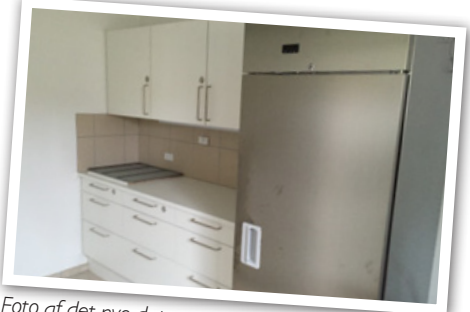
Foto af det nye depot marts 2016 Gudumborgerne har ind rillet kabler og monteret dåser for el. Vi har også lavet nyt dør hul til depotet og repareret væggen i køkken.