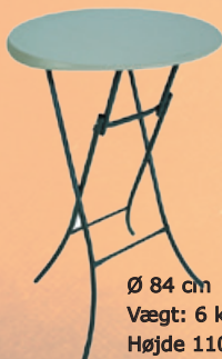
Cafebord - Ståbord