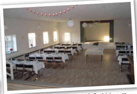
Den færdige sal december 2013. Nybygget inkl. nye fundamenter, nyt velisoleret terrændæk, nye vægge og ny tagkonstruktion.