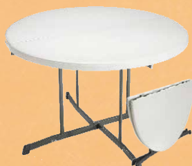
Rundt bord: Fold in half