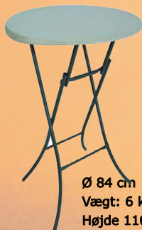
Cafebord - Ståbord