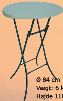
Cafebord - Ståbord