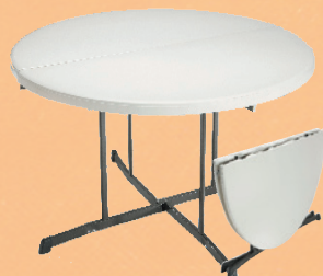
Rundt bord: Fold in half