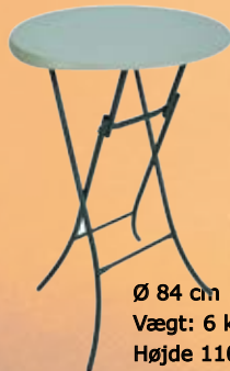
Cafebord - Ståbord