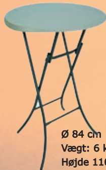
Cafebord - Ståbord