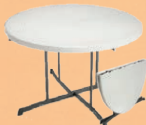
Rundt bord: Fold in half