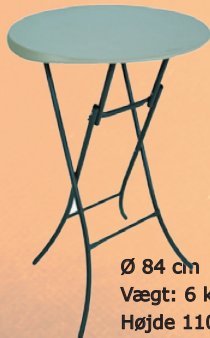
Cafebord - Ståbord