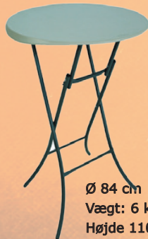
Cafebord - Ståbord