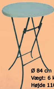
Cafebord - Ståbord