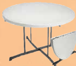
Rundt bord: Fold in half