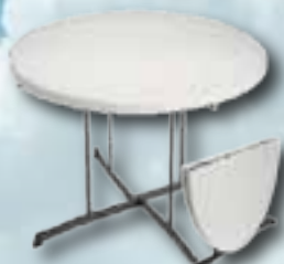
Rundt bord: Fold in half

Ø 153 cm - Vægt: 20 kg Farve: Granit og mandel