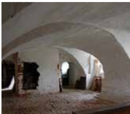
Den gamle folkestue i kælderen under Ørslev Kloster

I 1992 blev jeg valgt ind i bestyrelsen for Forsamlingshuse i Fyns Amt, i 1997 blev jeg næstformand, og i 2001 formand og her i 2010 trak jeg mig ud. Det har været spændende at være med i arbejdet med forsamlingshusene, der er sket meget i årenes løb og mere ville der ske hvis bestyrelserne kunne få endnu bedre økonomi end de har.