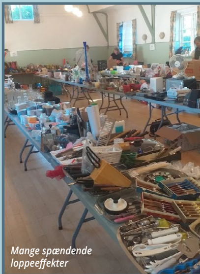
Mange spændende loppeeffekter