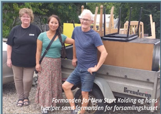
Formanden for New Start Kolding og hans hjælper samt formanden for forsamlingshuset