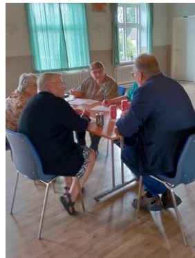
- og samarbejdes i grupperne.