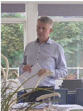
Formanden leder mødet.