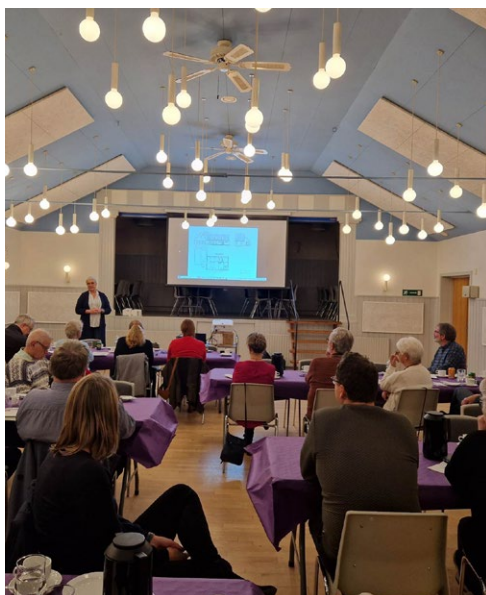
Ebdrup forsamlingshus før renoveringen

En helt igennem positiv aften for vores medlemmer.