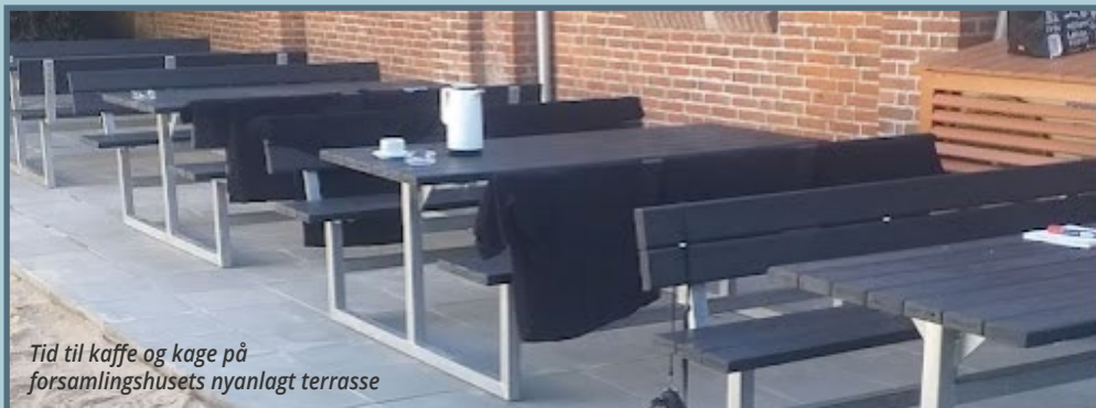
Tid til kaffe og kage på forsamlingshusets nyanlagt terrasse