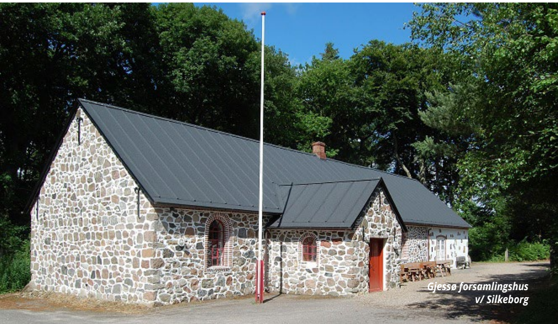
Gjessø forsamlingshus v/ Silkeborg

Bestyrelsen forsøger at lave en geografisk spredning, således der ikke kommer 2 arrangementer i samme område inden for nogle få måneder.